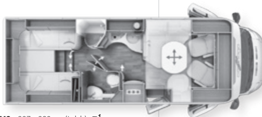
742 x 227 x 289 cm (Lxlxh) 🚲