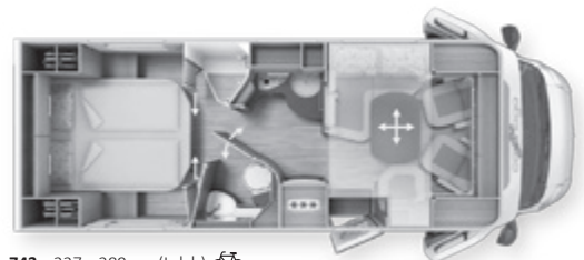
743 x 227 x 289 cm (Lxlxh) 🚲