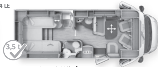
713 x 227 x 294/289 cm (Lxlxh)* 🚲