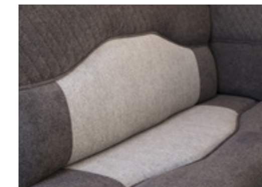
Graphite (En option □, Tissu)