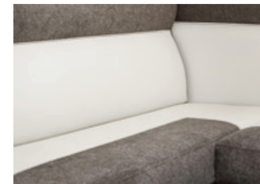
Melange (De série ■, Tissu/Simili-cuir)