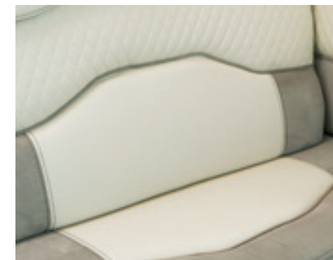
Marble (De série ■, Tissu/Simili-cuir)