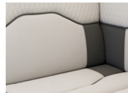
Slate (En option □, Simili-cuir)