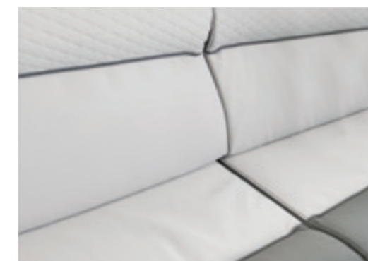
Satin (En option □, Simili-cuir)