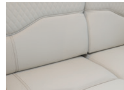
Nabuk (En option □, Tissu/Simili-cuir)