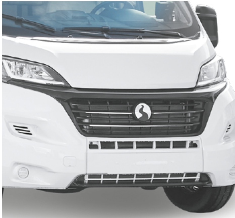
PARE-CHOCS AVANT PEINT