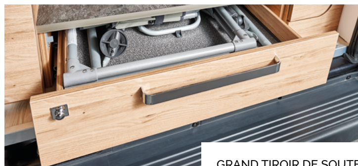
GRAND TIROIR DE SOUTE