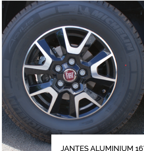
JANTES ALUMINIUM 16"