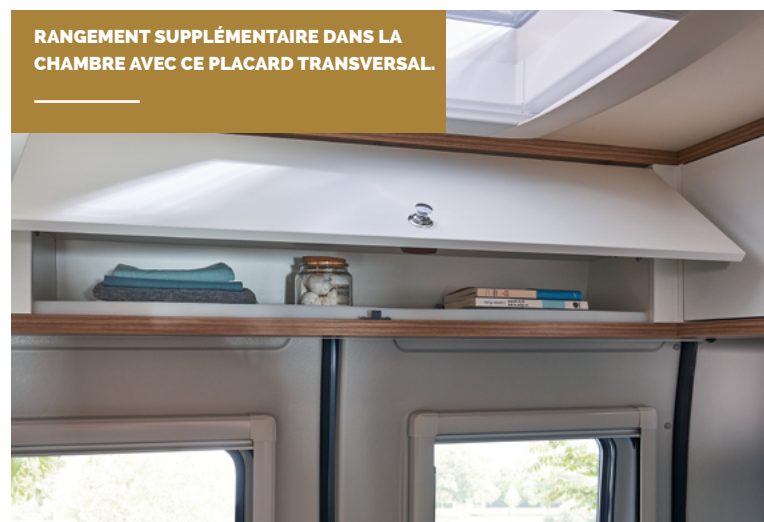
RANGEMENT SUPPLÉMENTAIRE DANS LA CHAMBRE AVEC CE PLACARD TRANSVERSAL.