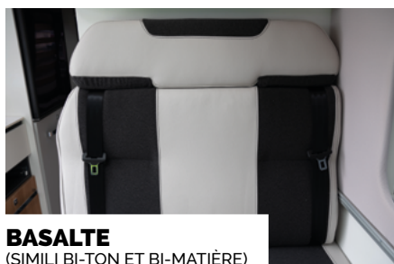
BASALTE (SIMILI BI-TON ET BI-MATIÈRE)