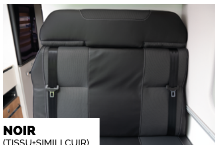
NOIR (TEKSU+SIMILI KUR)