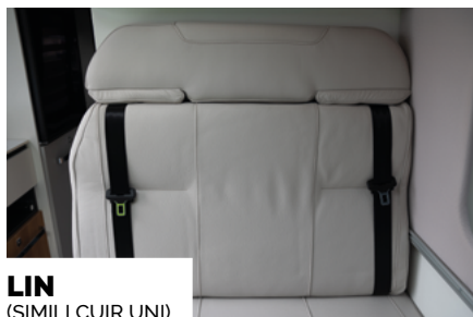
LIN (SIMILI KUR UNI)