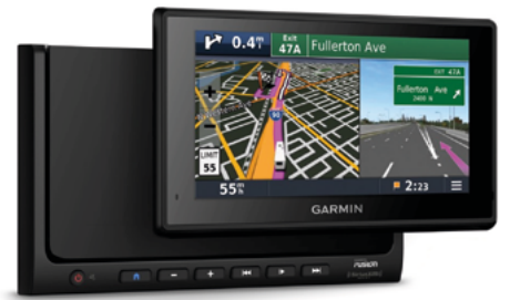
TABLETTE GPS GARMIN FUSION