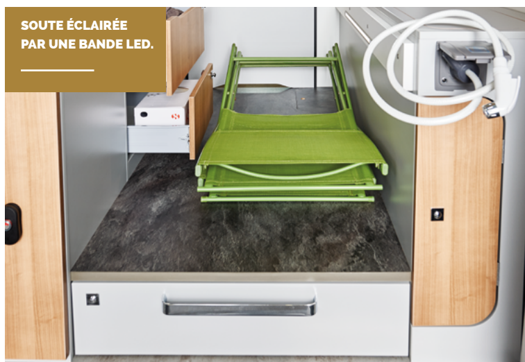
SOUTE ÉCLAIRÉE PAR UNE BANDE LED.