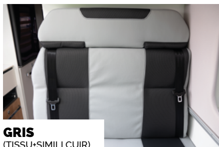
GRIS (TEKSU+SIMILI KUR)