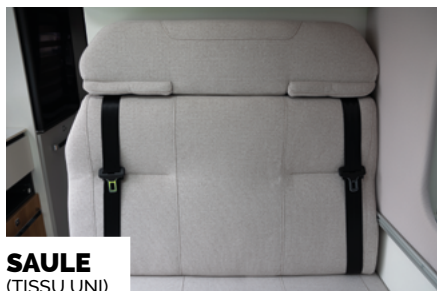
SAULE (TEKSU UNI)