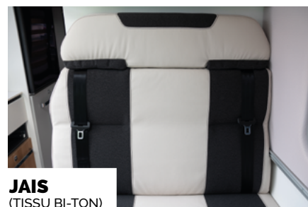
JAIS (TEKSU BI-TON)