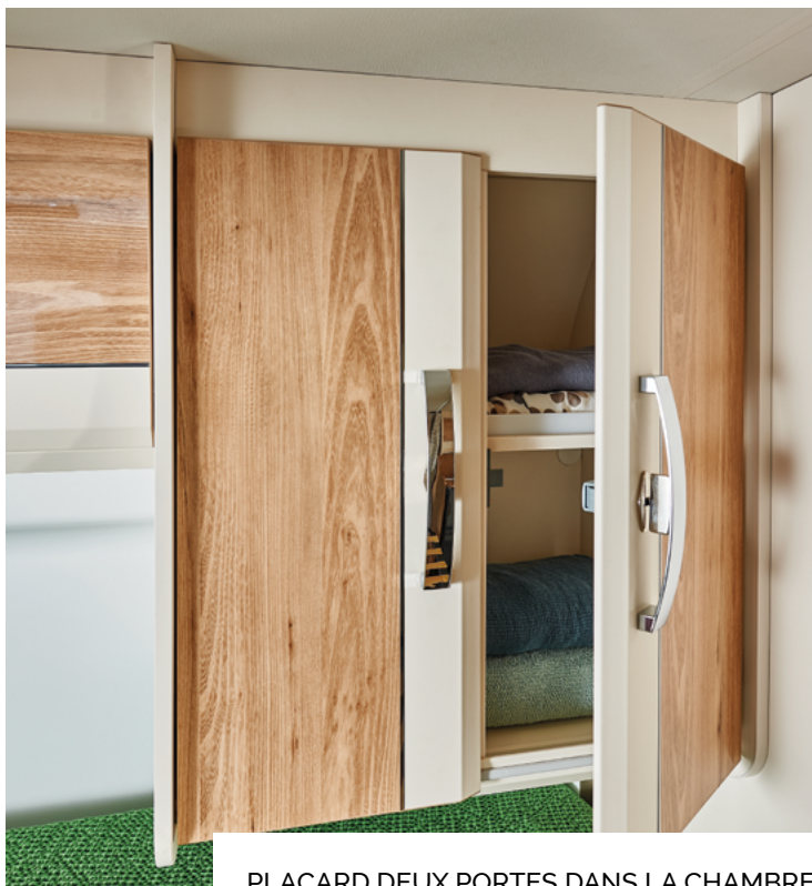
PLACARD DEUX PORTES DANS LA CHAMBRE