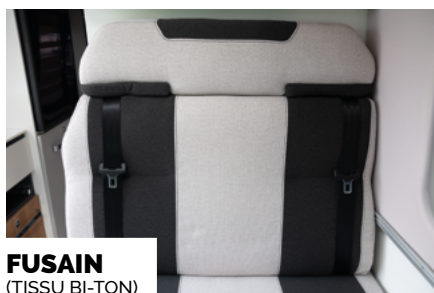
FUSAIN (TEKSU BI-TON)