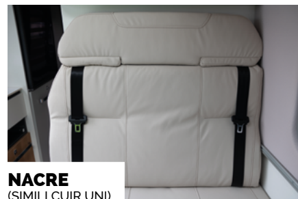
NACRE (SIMILI KUR UNI)