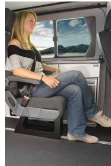
Siège pour 6ème place carte grise