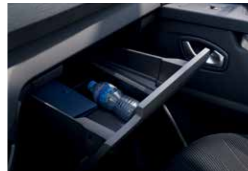
Rangement réfrigéré avec air conditionné