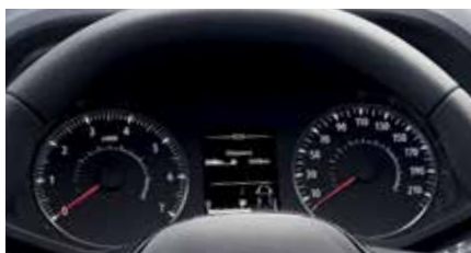
Compte-tours en noir et blanc