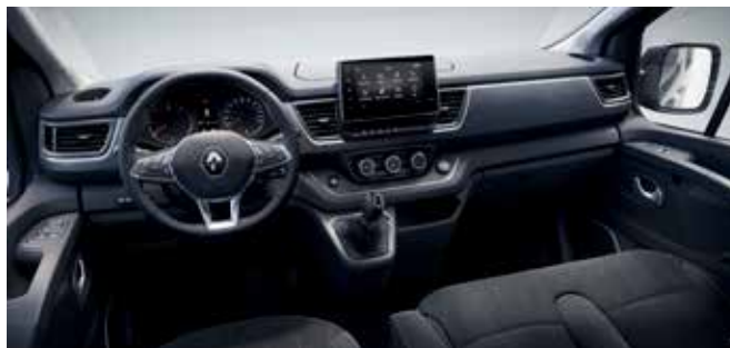
Tableau de bord avec détails décoratifs (sans radio)