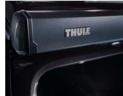
Store, longueur 2,3m