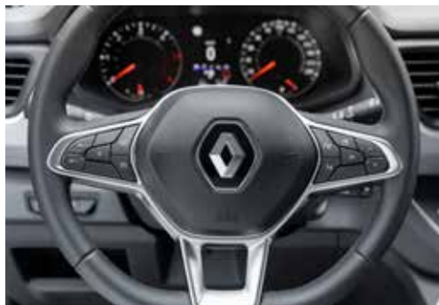
Volant en cuir