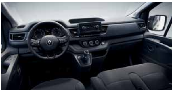
Tableau de bord (sans radio)