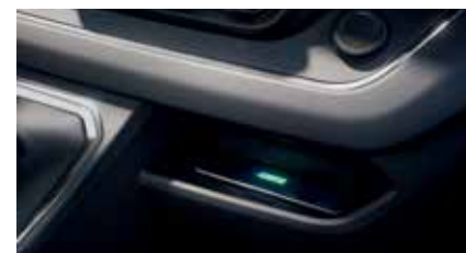
Chargeur de téléphone sans fil