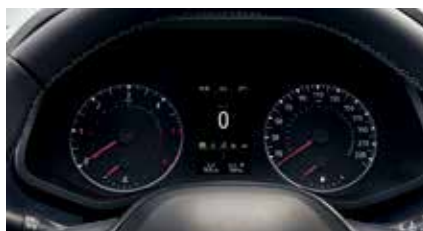
Compte-tours en couleur