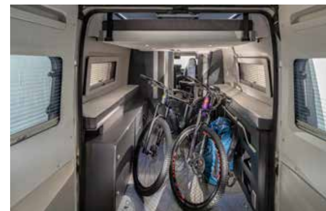
Soute garage XXL conçue pour les sportifs et leur matériel!