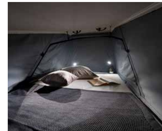
Lit "Pop Top" aux dimensions généreuses pour deux adultes.