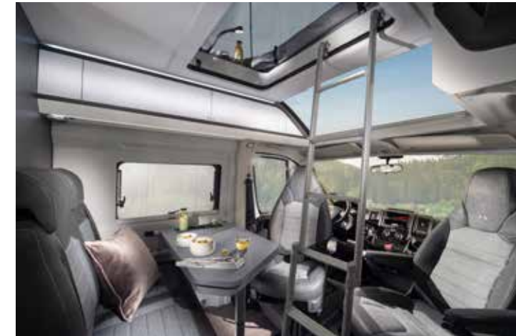
Accès facile au couchage supérieur.