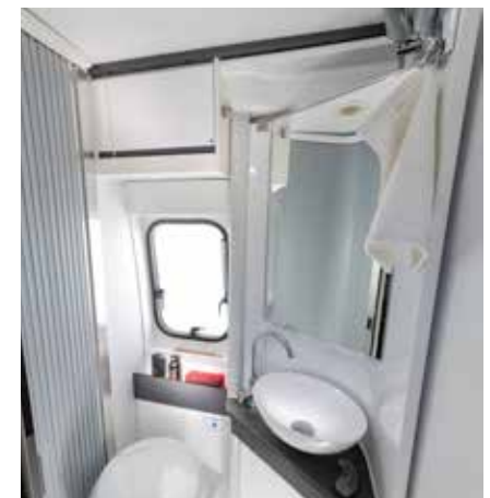
Cabine de douche Duplex avec mur de séparation pivotant.