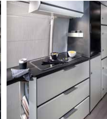
Cuisine fonctionnelle et ergonomique avec réchaud deux feux, évier et réfrigérateur à compression.