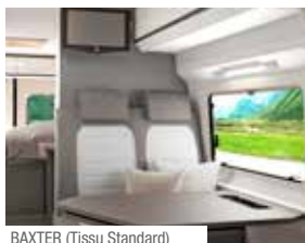
BAXTER (Tissu Standard)