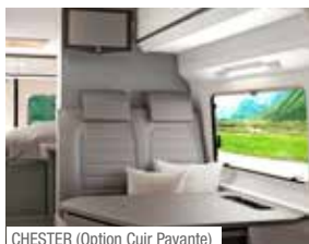
CHESTER (Option Cuir Payante)