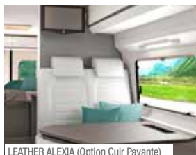
LEATHER ALEXIA (Option Cuir Payante)